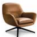
5 JENSEN POLTRONA CM 81X85 H78