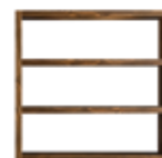
12 JOHNS LIBRERIA CM 180X40 H174